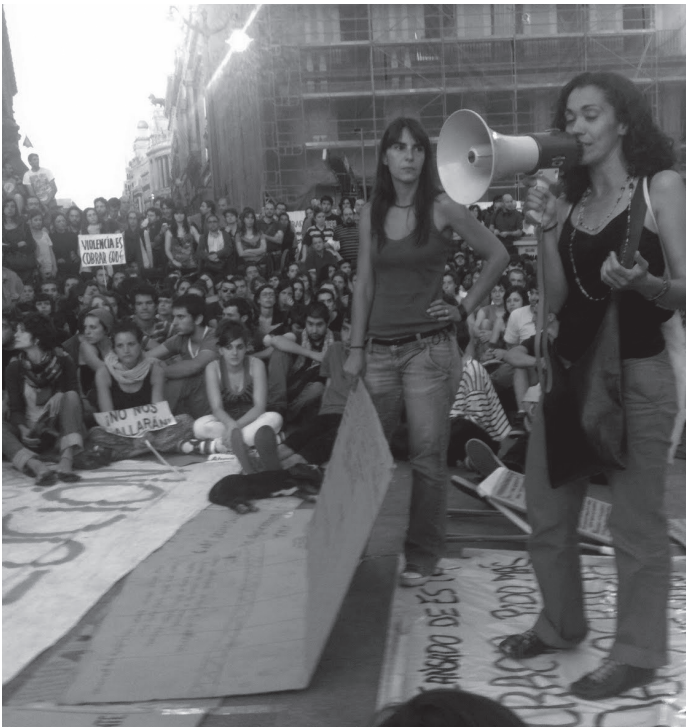
אסיפה המונית כיכר פוארטה-דל-סול במדריד, ספרד

תנועות המחאה של הצעירים, ההפגנות בכיכרות והשביתות הגדולות